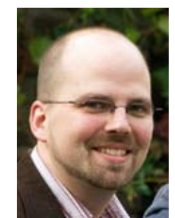
Bis bald im Camp, Euer

In allem vertrauen wir darauf, dass das Christ Camp ein Glaubenswerk ist, das nicht uns gehört, sondern Christus. „Er sorgt für euch!“ (1Pet 5,7)